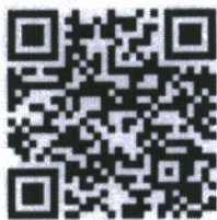
แนวปฏิบัติ ในการดำเนินการวิจัยในมนุษย์

กองมาตรฐานการศึกษาและวิจัย โทร. ๐ ๒๒๘๐ ๐๐๙๑ - ๖ ต่อ ๔๐๒๔ E-mail : iccs-5@iccs.ac.th