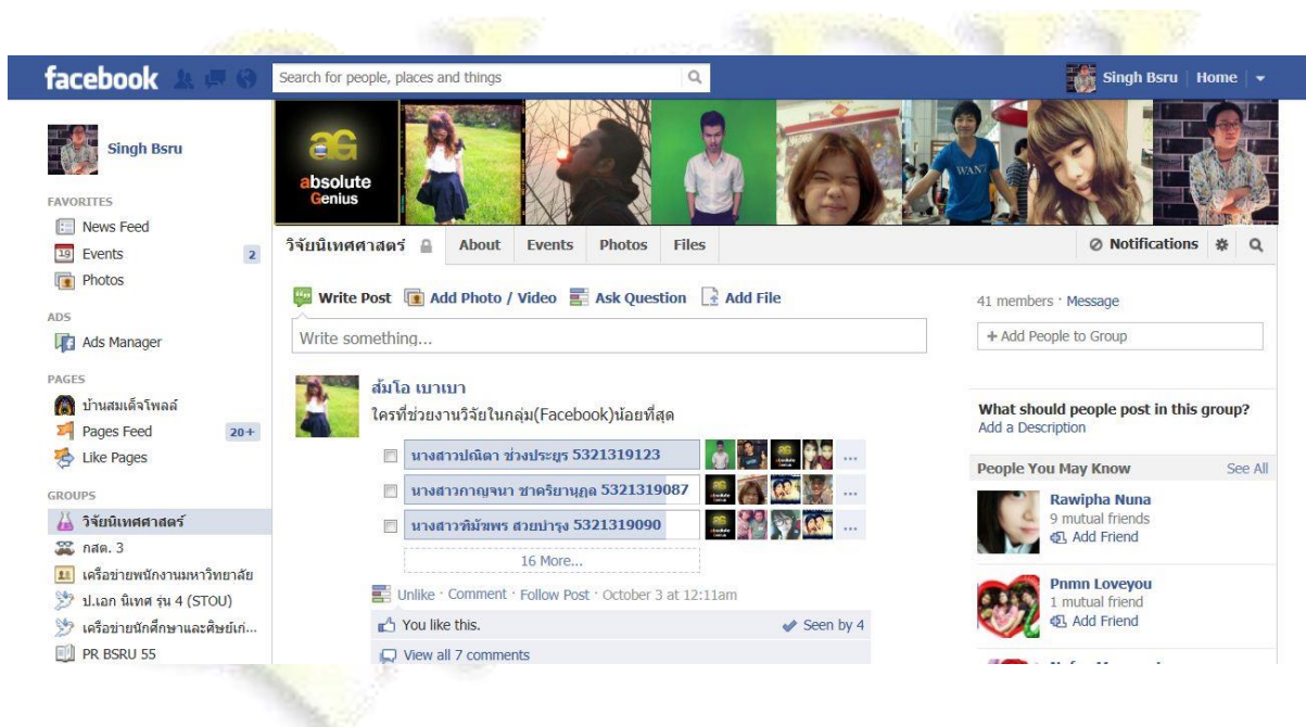
ภาพที่ 2 กลุ่มของนักศึกษารายวิชาการวิจัยนิเทศศาสตร์ในเฟสบุ๊ค

การเก็บรวบรวมข้อมูล ผู้วิจัยจะนำแบบทดสอบที่ผ่านการทดสอบและแก้ไขเรียบร้อยแล้ว ไปดำเนินการเก็บรวบรวมข้อมูลโดยผู้วิจัย ได้ดำเนินการทดสอบวัดผลสัมฤทธิ์ทางการเรียนของกลุ่มทดลองใช้บทเรียนการสอนผ่านสื่อเครือข่ายสังคม และกลุ่มควบคุมที่ไม่ใช้บทเรียนการสอนผ่านสื่อเครือข่ายสังคม จำนวน 60 คน ในระหว่างวันที่ 1- 27 กันยายน 2555 แล้วนำข้อมูลทั้งหมดไปวิเคราะห์ทางสถิติ