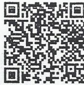
QR Code ลงทะเบียนชำระเงิน

12.2 หลังจากโอนเงินเรียบร้อยแล้วแจ้งรายละเอียดในการออกใบเสร็จให้ชัดเจนพร้อมส่งหลักฐานการชำระเงินผ่านระบบออนไลน์โดยสามารถสแกน QR Code